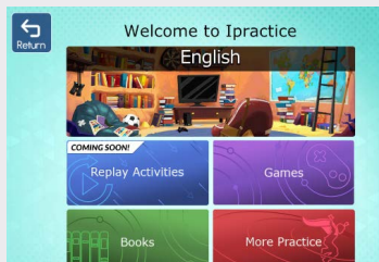
Menú de Lectura de Ipractice